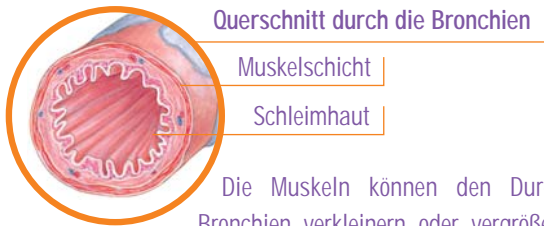
Querschnitt durch die Bronchien

Die Bronchien bestehen aus einer ringförmigen Muskelschicht, die innen mit einer dünnen Schleimhaut (der Mukosa) ausgekleidet ist.